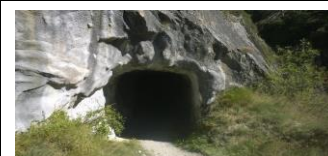
Tunnel Bau- Bahn