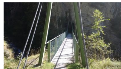
Brücke über die Baltschiederschluft

Lalden Dorf ab 17:18 Bus 511 Brig an 17:38 ab 17:49 Zürich HB an 19:58