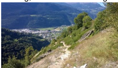
Abstieg zum Baltschiederviadukt

Wir nehmen nun den kurzen Abstieg, teils auf der Fahrstrasse und dann wieder über Feldwege hinunter zum Dorf Laden unter die Füsse. Im Restaurant Brückenhof lassen wir unseren Tag ausklingen. Vielleicht liegt da ja noch eine Überraschung drin. Nach einer gemütlichen Runde steigen wir ins Postauto ein, welches uns nach einer anspruchsvollen, fantastischen Wanderung in einer wundervollen Berglandschaft nach Brig bringt. Bei sehr schlechter Witterung fahren wir von Ausserberg mit dem Zug Brig und können das Stockalperschloss besuchen (rollende Planung).