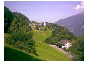
Blick auf Obstalden

Totale Wanderzeit (Leichtes Auf und Ab) 3 1/4 Std