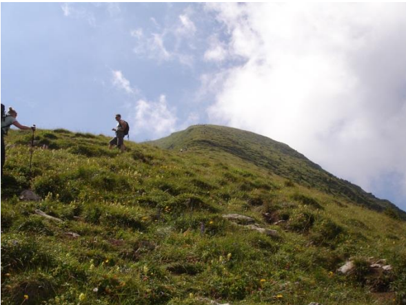
Aufstieg zum Leistchamm