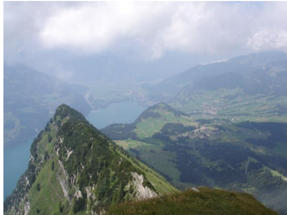
Blick vom Gipfel