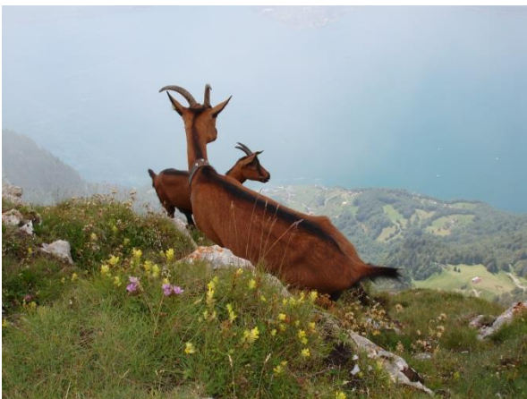
Nicht nur Alpinisten auf dem Gipfel