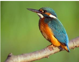
Eisvogel - Martin-Pecher