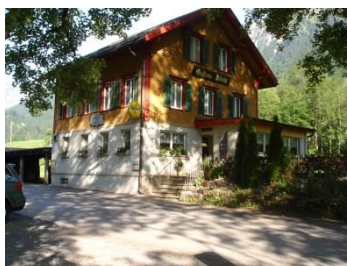
Restaurant Klöntal Plätz