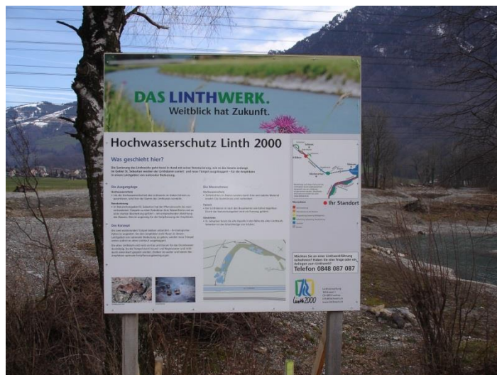
Dämme wurden verstärkt, Hochwasserschutz