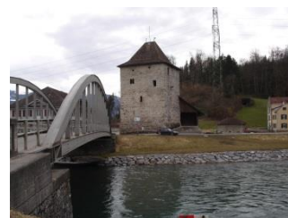
Ziel Schloss Grynau

Anmeldung: Ich melde mich für die Wanderung vom 17. Oktober 2013 an