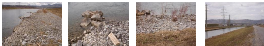
Bilder entlang des Linthkanals

per Post: Hans Schärer, Falletenbachstrasse 5, 8867 Niederurnen per E-Mail: h.schaerer@onflow.ch